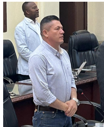
El diputado William Campiño fue uno de los más críticos a la gerencia del hospital

Se dice que hay un déficit en más de cinco mil millones de pesos de la vigencia 2023, deprimiento patrimonial, sobrecostos en obras que se realizaron, pésimo y costoso servicio de ambulancias, no pago a personal médico, asistencial y especialistas de manera oportuna, etc.