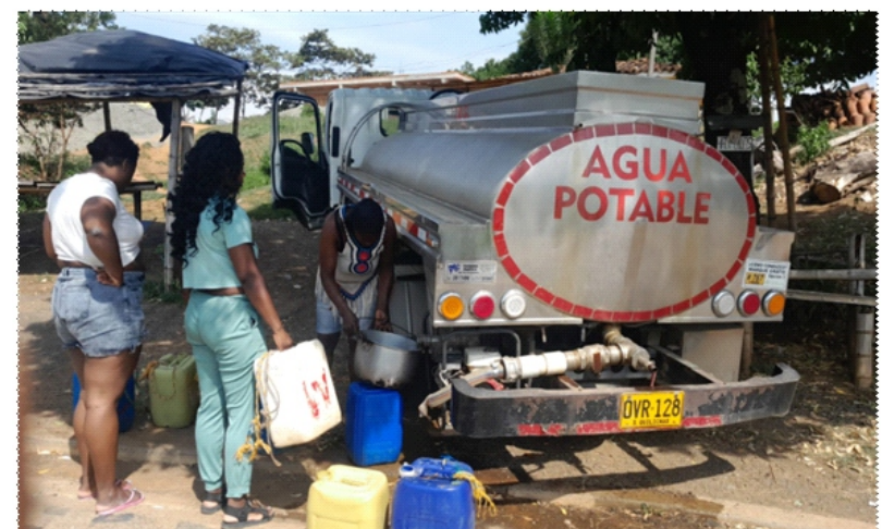
Carro cisterna de Emquilichao ESP, llevando el agua potable a las comunidades de Santander de Quilichao.

Cabe destacar el excelente desempeño del personal operativo de la entidad, durante la contingencia de aseo presentada en el mes de febrero, debido al cierre de la vía con bloqueo por parte de las agremiaciones afro, afiliadas a ACONC. Lo cual provocó que 2 vehículos recolectores de la empresa quedaran atrapados en la vía, y los otros vehículos no lograran pasar, generando un retraso del servicio de 2 días, que fue cubierto en 1 día con el plan de contingencia implementado por el equipo de aseo de la entidad, utilizando toda su capacidad operativa. Por lo cual extendemos la felicitación a los diferentes operarios de barrido, y recolección que debieron doblarse en sus funciones hasta altas horas de la noche para lograr superar la situación. Demostrando que Emquilichao ESP, está en buenas manos.