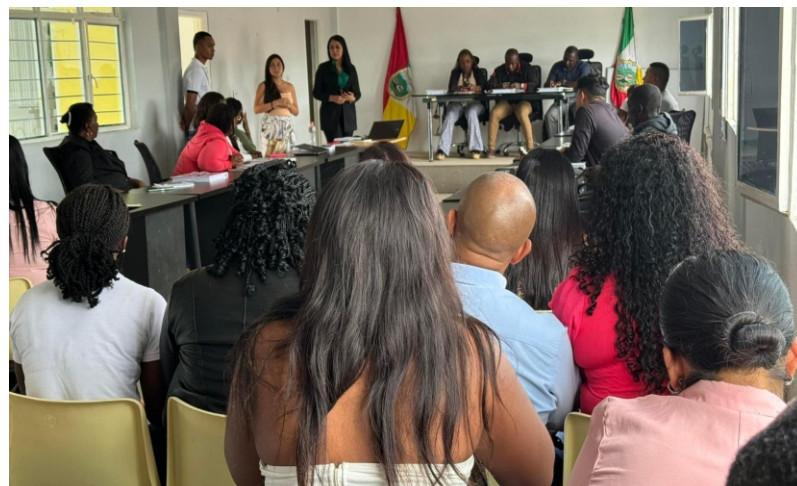
plan de desarrollo entregado el pasado 30 de abril, con el objetivo de seguir avanzando hacia un Buenos Aires mejor para todos y todas.