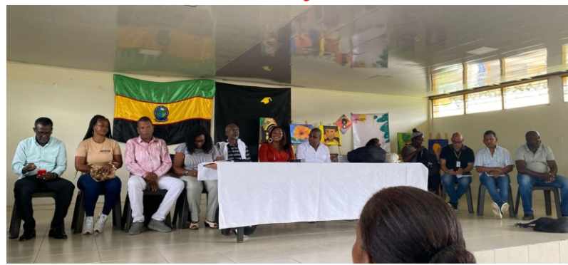
el fin de abordar las necesidades de las instituciones educativas, comunidades, y del orden público, buscando posibles soluciones a estas problemáticas.