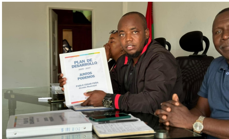
El equipo de gobierno realizó hoy la presentación de informes de los primeros 100 días ante el Concejo Municipal. Además, se analizó el