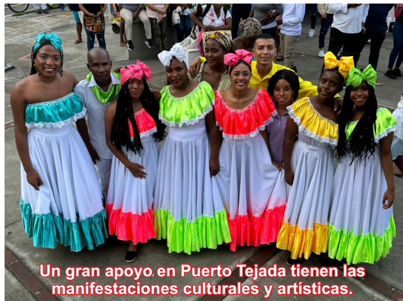
Un gran apoyo en Puerto Tejada tienen las manifestaciones culturales y artísticas.

Se agradeció a los organizadores del evento y a cada una de las agrupaciones que participaron en estas clasificatorias. Gracias a su esfuerzo y dedicación, se logró un evento memorable que destacó nuestro talento local y nuestra rica cultura.