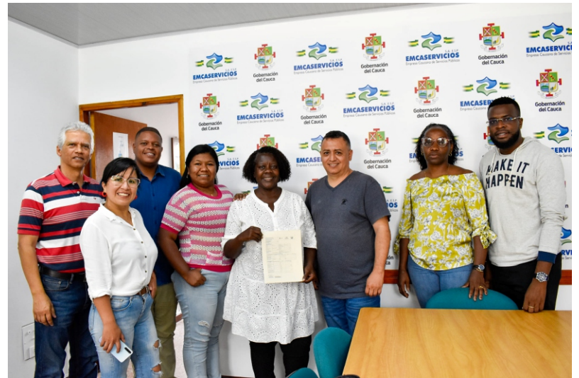
Se hace un buen acompañamiento a las obras que se ejecutan en los diferentes municipios del Cauca