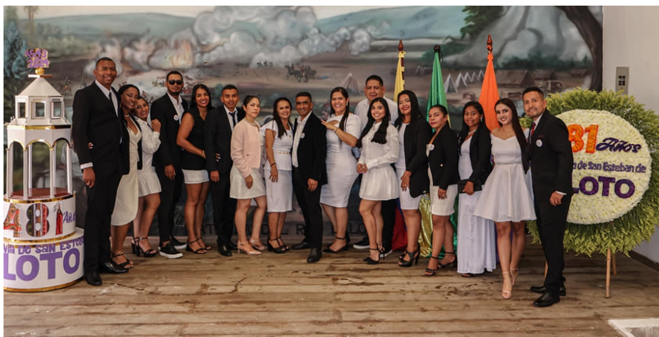
La Administración Municipal de Caloto en la celebración de los 481 años de Caloto reiteró su compromiso de trabajar por el pueblo caloteño.

Para destacar el apoyo que la comunidad le ofreció a la Administración Municipal para realizar estos grandes eventos.